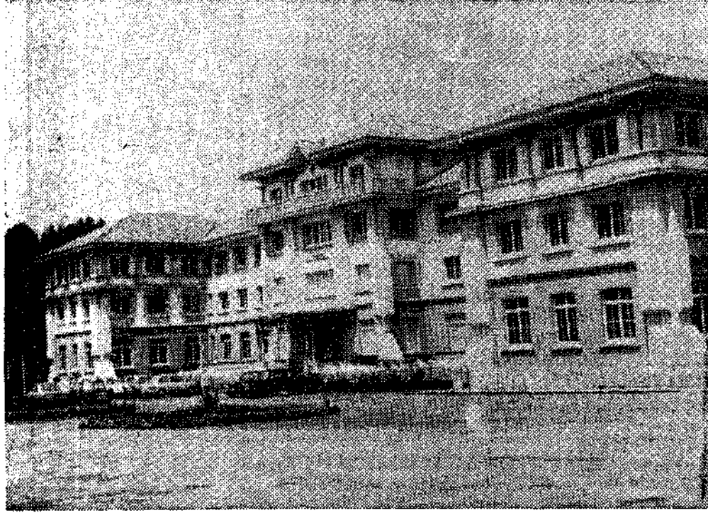
La Residencia "Jacobo Campuzano".

DIEZ MIL CIENTO DIEZ RESIDENTES PASARON EL PASADO AÑO POR ESTA EXCELENTE ZONA DE VERANEO