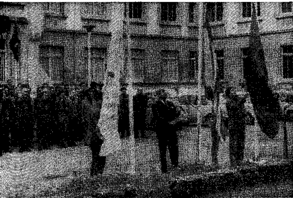
Comenzó ayer en la Ciudad Residencial de Perlorá una reunión general de mandos y dirigentes de Juventudes de toda la provincia dedicada al estudio de la situación general de