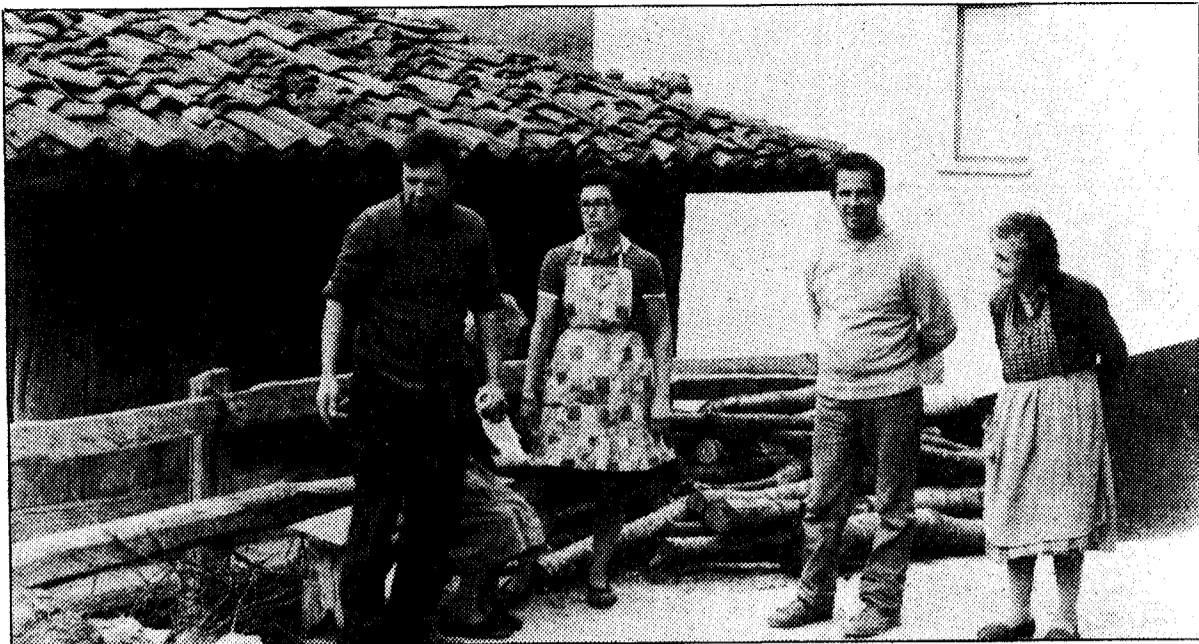
Los vecinos protestan por no tener suficiente agua, viviendo al lado de la presa de Tanes. A la derecha, tres grúas instalan las vigas del nuevo puente de Coballes