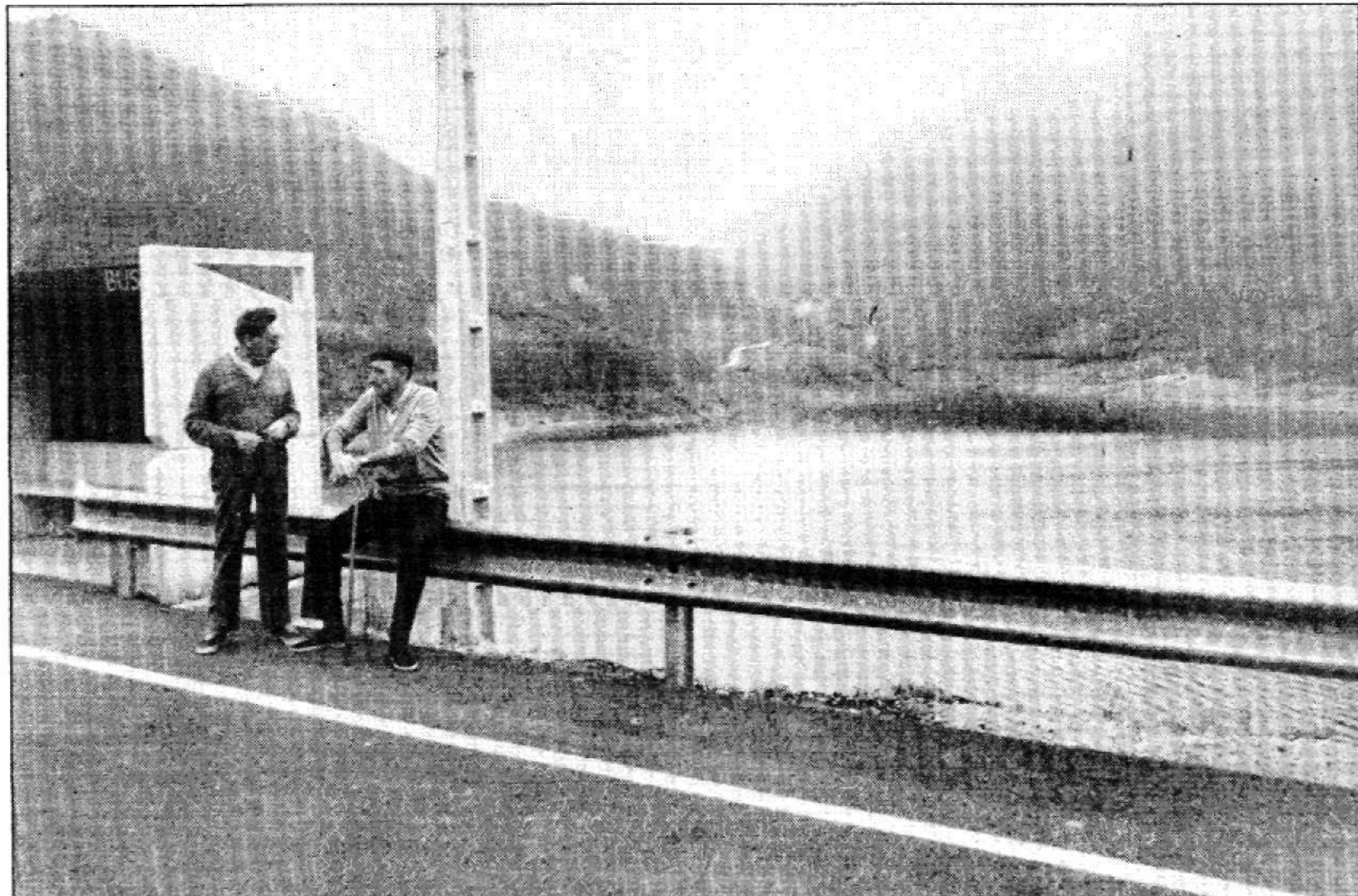
El embalse de Cadasa en la localidad casina de Tanes, uno de los pueblos que ha sufrido restricciones en el suministro de aguas.