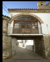
La Puebla de Híjar