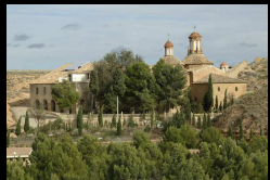
Samper de Calanda