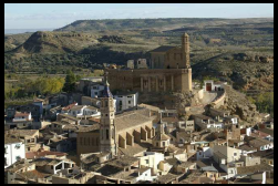
Albalate del Arzobispo