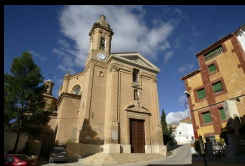
Urrea de Gaén