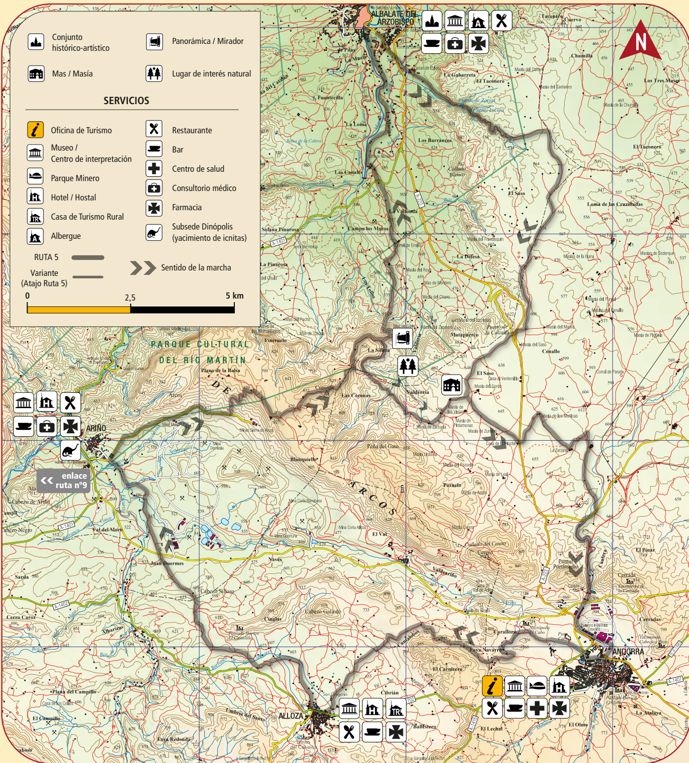
ALBALATE DEL ARZOBISPO