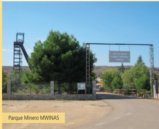
Parque Minero MWINAS