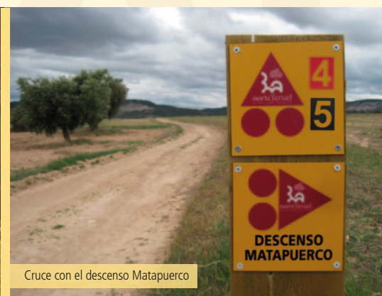
Cruce con el descenso Matapuerco