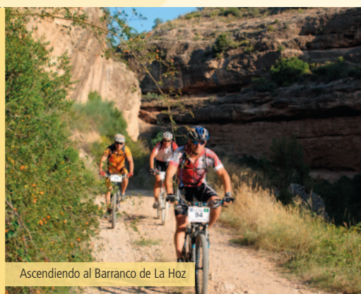
Ascendiendo al Barranco de La Hoz