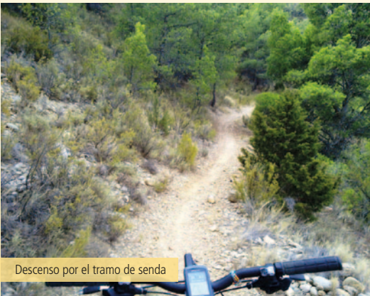
Descenso por el tramo de senda