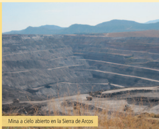
Mina a cielo abierto en la Sierra de Arcos