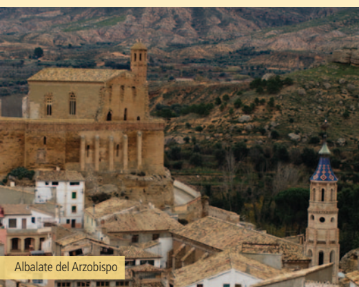
Albalate del Arzobispo

El camino permanece en buen estado, en algunos tramos es bastante pedregoso, aunque la subida alterna tramos más llanos con otros de pequeños repechos de gran pendiente.