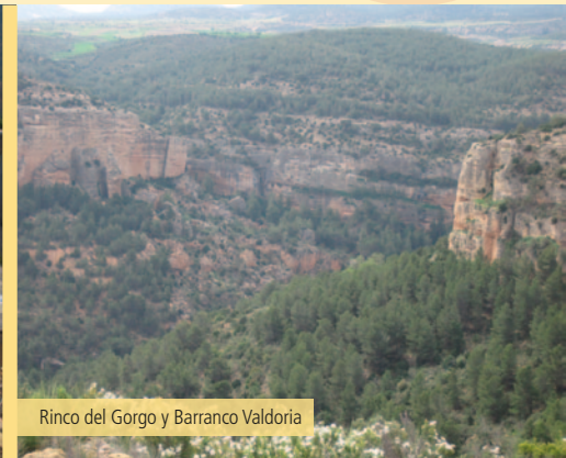
Rinco del Gorgo y Barranco Valdoria