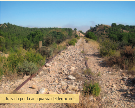
Trazado por la antigua vía del ferrocarril