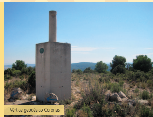
Vértice geodésico Coronas