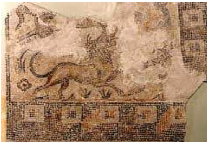
Imagen del mosaico aparecido en Urrea de Gaén sobre la leyenda de Belerofonte

El mosaico aparecido en Urrea representa la leyenda de Belerofonte. Esta historia narra como, por una historia de amor no correspondido con una reina, el rey de Licia debe matar a Belerofonte por encargo de Preto (otro rey). Por eso obliga a Belerofonte a luchar con la Quimera, un monstruo con cabeza de león, cuerpo de cabra y cola de serpiente que escupía fuego. Con la ayuda del caballo alado Pegaso, el héroe Belerofonte superó al monstruo, casándose con la hija del rey. Pero el triunfo hizo que se volviera un engreído, por lo que el dios griego Zeus lo fulminó con un rayo. La imagen del héroe luchando con la Quimera es la que representa el mosaico de Urrea, que ahora podemos ver en el Museo Provincial de Teruel.