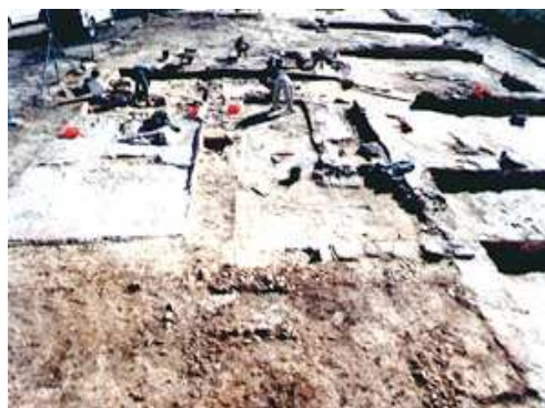
Arqueólogos durante la excavación de la villa romana

En Urrea de Gaén están los restos de una villa romana conocida como La Loma del Regadío. Fue descubierta hace más de cincuenta años por una arqueóloga, aunque su investigación definitiva se produjo unos años después, cuando se estaban haciendo obras en un camino. La villa se encuentra en ese sitio porque es una zona de riego (de ahí su nombre). Según los restos encontrados, esta villa se dedicaba al cultivo de olivos, viñas y cereal. Se han encontrado restos de un molino de aceite y de unos depósitos para almacenar el vino que ellos mismos fabricaban. Esta villa estuvo habitada desde el siglo III d.C. hasta principios del siglo V d.C.