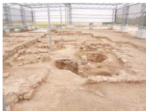
Restos de la villa romana de la Viilla del Regadío

¿En qué dos partes estaba dividida una villa romana? Nombra alguna diferencia entre las dos: