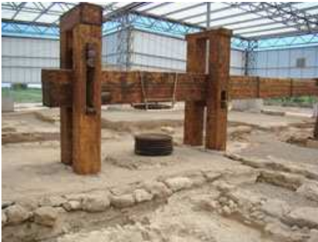
Prensa del molino de aceite de la villa romana de la Loma del Regadío.

Esta villa romana, como muchas otras, se construyó alrededor de un patio central con columnas. Toda la vivienda del propietario gozaba de numerosos lujos, aunque esta villa romana no es de las más ricas en decoración. Muchas de las paredes de las habitaciones estaban decoradas con pinturas de distinto tipo. En los alrededores de la vivienda del dueño se han encontrado un molino de aceite y depósitos para el vino. Se puede decir que la Loma del Regadío era una fábrica de aceite y vino a gran escala, por lo que debemos imaginarnos todos los campos que rodean la villa repletos de viñas y olivos. En el yacimiento se ha reconstruido parte del molino.