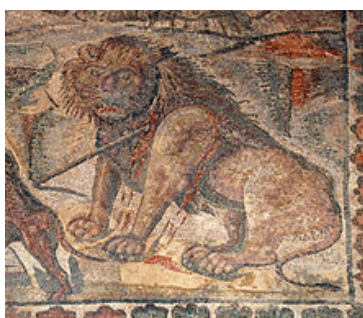
Mosaico de la villa de la Olmeda

En 1998 se encontró un gran mosaico en los restos de la Villa Romana de la Loma del Regadío. Un mosaico es una forma de decoración que usaban los romanos. Los mosaicos se componen de trocitos de piedra de distintos colores para formar dibujos e imágenes que se colocaban generalmente en los suelos de las habitaciones. A estos trocitos de piedra que se usan para hacer los mosaicos se les llama teselas y cada mosaico lo pueden formar miles de teselas. En griego la palabra mosaico significa "Lugar de Musas"