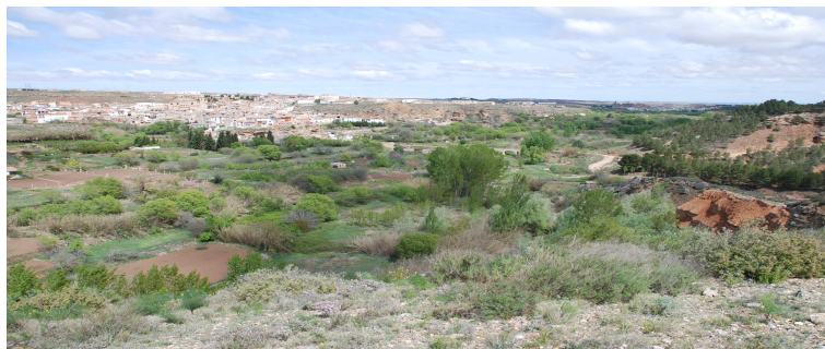
La villa romana de la Loma del Regadío está en la localidad de Urrea de Gaén

¿Qué se dedicaban a fabricar los habitantes de la Loma del Regadío?