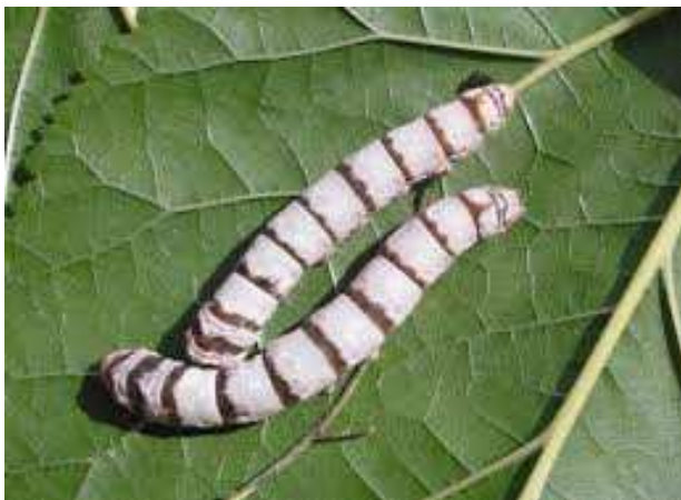
Una pareja de gusanos de seda.