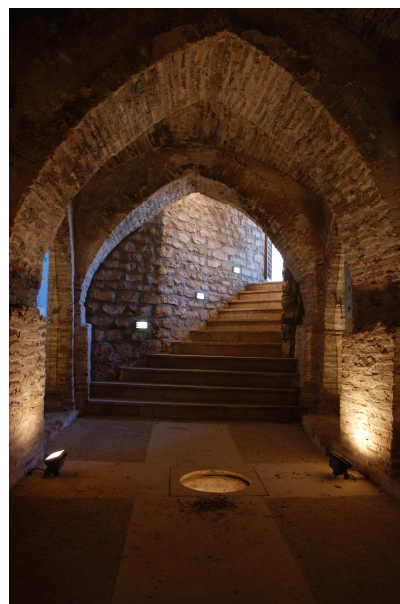
La Cripta de Jatiel era en realidad una gran bodega.

Una cripta es un lugar subterráneo donde se enterraba a los muertos. En muchas ocasiones estaba debajo de las iglesias. Por eso, parece ser, que la Cripta de Jatiel no es en realidad un cripta sino un cillero, aunque tampoco se está seguro de esto. Un cillero es un almacén o bodega que se usaba para guardar todo tipo de cosas: alimentos, vino, cereal, aceite... El de Jatiel es, seguramente, del siglo XV y lo que más destaca de él son sus fuertes arcos. Antes no se sabía que existía y se encontró debajo de un corral, a varios metros de profundidad bajo tierra. Esta cripta formó parte del castillo que la Orden de San Juan tenía en Jatiel.