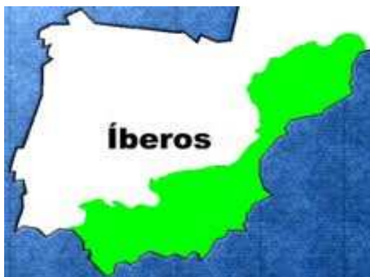
Mapa de los íberos en España

¿En qué parte de la Península Ibérica vivían los íberos?: