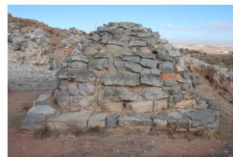
Cabezo de Alcalá

Se cree que los primeros que vivieron en este lugar fueron unas tribus celtas provenientes del centro de Europa, que llegaron hace dos mil novecientos años. Los siguientes en habitar el cabezo fueron los íberos, que llegaron en el siglo III a.C. Poco después llegaron los romanos, que cambiaron la forma de vida de los habitantes de esta ciudad. Esto es lo que se llama romanización. La mayor parte de los edificios que hoy podemos ver son de esta época. La ciudad fue destruida en el año 76 a.C. debido a una guerra que estalló en la Península Ibérica entre romanos.