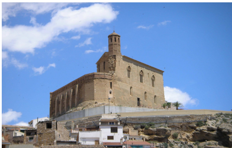
Vista del Castillo de Albalate