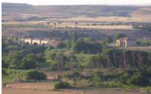
Antigua vía de Val de Zafán cerca de Samper de Calanda

La línea del tren de Val de Zafán se cerró en 1973 por que se hundió un túnel en Cataluña. Por eso, unos años después se reformó la vía para poder caminar o ir en bici por ella. Eso es lo que se llama una vía verde. Si quisiéramos, podríamos ir andando por la vía desde La Puebla de Híjar hasta Tortosa, aunque son más de 100 kilómetros y tienes que atravesar túneles como el de Valdealgofa (de más de dos kilómetros) o puentes como el de Samper de Calanda.