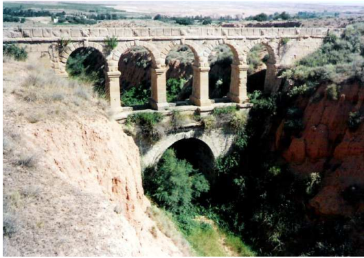
El acueducto de la Torica está entre La Puebla de Híjar y Samper de Calanda

La Torica es un acueducto que se levanta sobre la línea de tren abandonada entre La Puebla de Híjar y Samper de Calanda. Sirve para que una acequia pueda atravesar la línea del tren de "Val de Zafán". A esta línea, que llegaba hasta el mar Mediterráneo, los vecinos de La Puebla la conocían como La Torica, igual que a este acueducto. Este nombre viene de una locomotora que también se llamaba así. Este acueducto, aunque algunos piensan que es romano, fue construido hace más de cien años y está compuesto por seis arcos: cinco arriba y uno abajo.