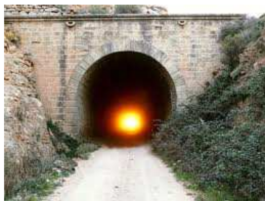
El sol atraviesa el túnel de Valdealgofa

En Valdealgofa, un pueblo cercano a Alcañiz por donde pasa la Vía Verde de Val de Zafán, hay un túnel de casi tres kilómetros y que los días de los equinoccios de primavera y otoño (marzo y septiembre) el sol se alinea con el túnel, lo que permite que los rayos del sol atraviesen de extremo a extremo el túnel.